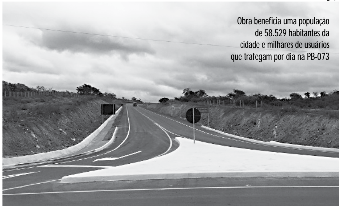
Obra beneficia uma população de 58.529 habitantes da cidade e milhares de usuários que trafegam por dia na PB-073