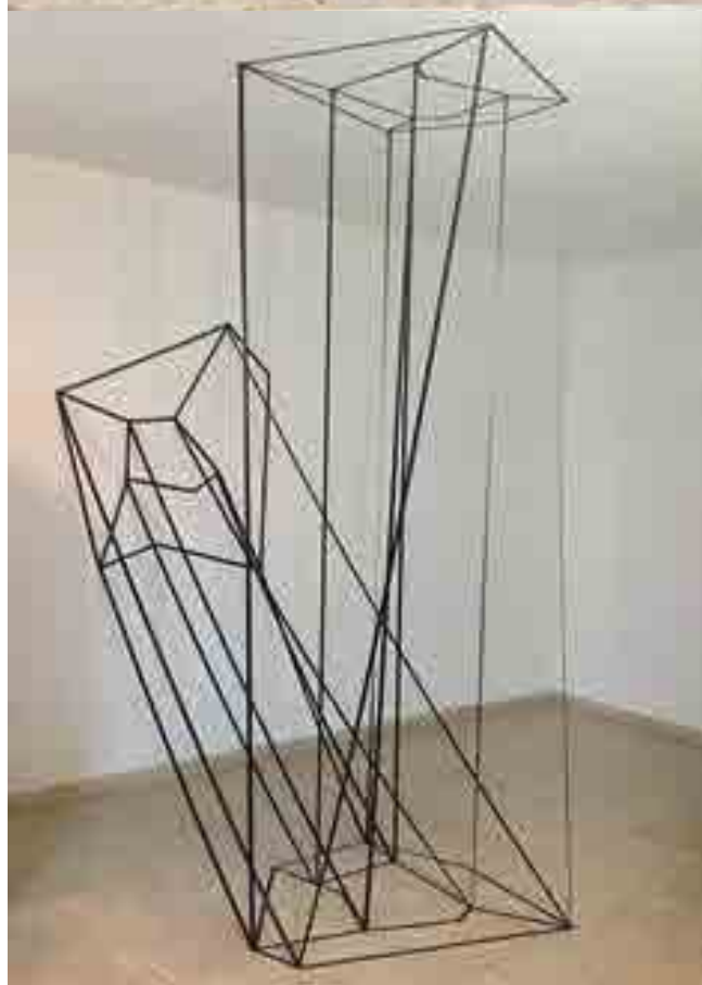
A efemeridade e a subjetividade são facilmente detectadas neste trabalho de Wellington Medeiros