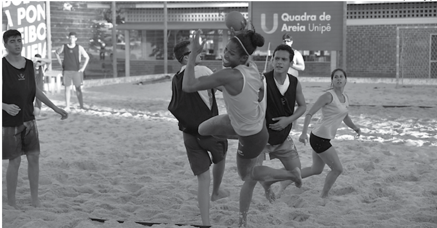
Atletas da Seleção Brasileira seguem treinando na quadra de areia do Unipê para as disputas na Polônia, tanto no masculino como no feminino