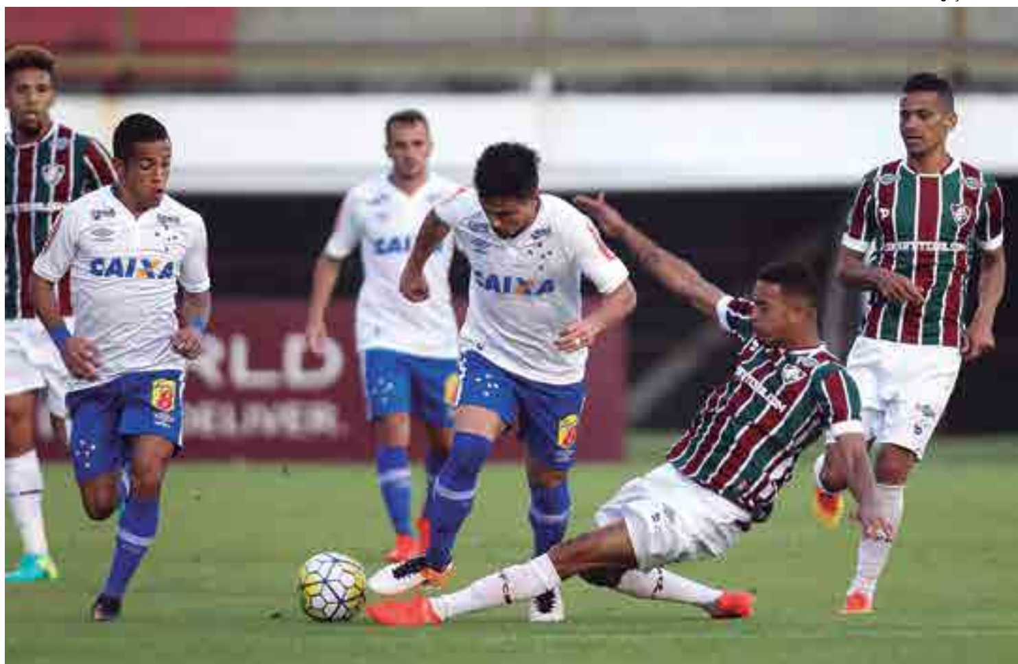
O Cruzeiro está na sétima posição do Brasileiro, enquanto o Fluminense ocupa a décima, o que aumenta a importância do jogo desta noite no Rio de Janeiro

Em entrevista ao Jornal Estado de Minas, o técnico Mano Menezes apontou outras opções, mas admitiu o camisa 99 à frente na disputa. "Sassá tem uma boa possibilidade de ser o escolhido, mas vamos ver um pouquinho da questão dos outros jogadores. Vamos ver como Alisson e Élber estão. Isso vai influenciar na escolha do homem que vai jogar mais adiantado, provavelmente Sassá", declarou o comandante.