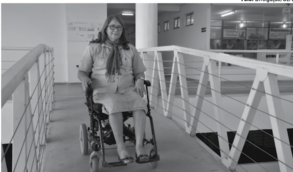
Equipamentos vão promover a mobilidade de professores, técnicos, estudantes e visitantes no campus